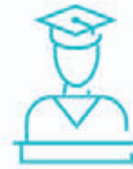
EĞİTİM VE DANIŞMANLIK