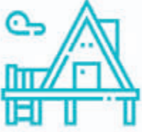
TURİZM VE HİZMET