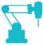
MAKİNE VE YEDEK PARÇA ÜRETİMİ