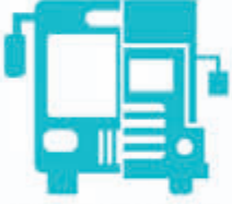
ULAŞIM VE LOJİSTİK