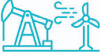
ENERJİ VE YEŞİL ENERJİ