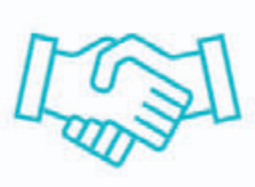
HUKUK VE ARABULUCULUK